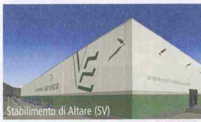
Stabilimento di Altare (SV)