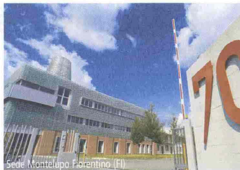
Sede Montelupo Fiorentino (FI)