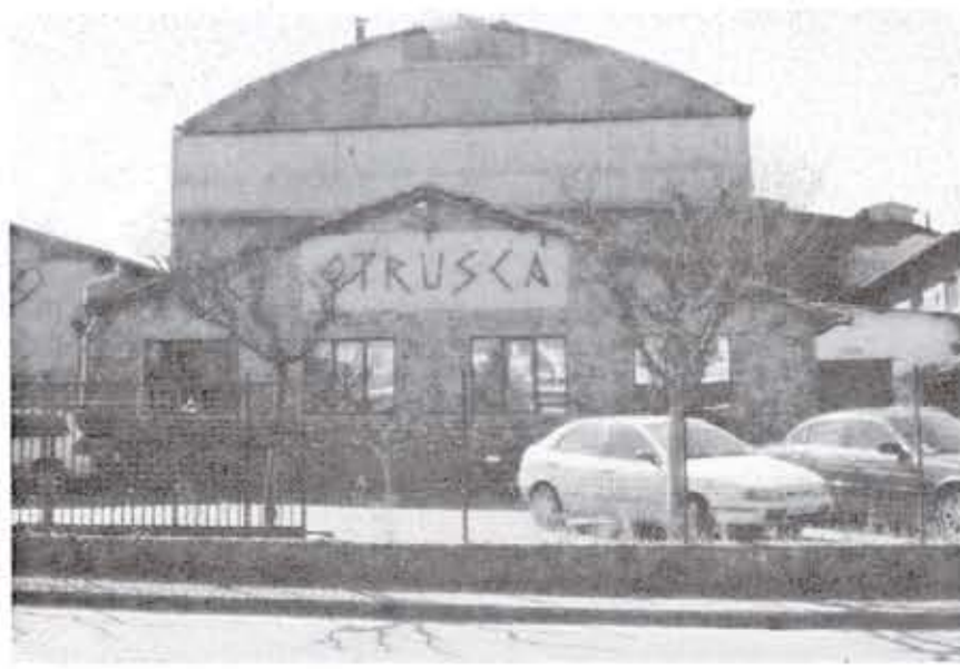
La vecchia sede della Vetreria Etrusca, a Montelupo

I numeri. La Vetreria Etrusca ha circa 150 addetti fra operai, tecnici e addetti commerciali. La produzione si avvale di un forno fusorio con una produzione media di 130 tonnellate al giorno. In tutto le linee di produzione sono tre, con tre colori di vetro. In tutto il catalogo ha oltre 1.000 modelli diversi per capacità, tipo e colore. Lo stabilimento di Altare (Savona) si estende su 45.000 mq di cui 18.000 coperti e 12.000 mq di magazzino per i prodotti finiti.